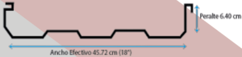
Lámina Pintro KR-18 de tipo SSR acanalado y engargolado.

Esta lámina es de fijación oculta mediante clips.